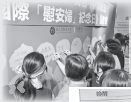
《814國際「慰安婦」記者會》現場貴賓於記者會背板簽下大名

婦援會多年來持續地在台灣社會中提倡「慰安婦」議題與國際人權運動，期盼歷史與人權價值，不會隨著「慰安婦」阿嬤們的凋零而消失殆盡，也期許歷史的傷痕能夠跨越時空與仇恨，與當代國際社會、女權及反性別暴力運動連結。