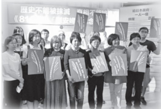
《814國際「慰安婦」記者會》現場貴賓手舉標語表達訴求

今年的8月14日國際「慰安婦」紀念日，有別於以往齊聚日本台灣交流協會前抗議，婦援會特別選擇在「阿嬤家-和平與女性人權館」舉行，當日力邀各界於「阿嬤家」暫時閉館前一同巡禮表達不捨之情，而記者會上除了維持往年訴求要日本政府道歉外，今年更呼籲課綱教材將「慰安婦」一詞正名為「慰安婦-軍事性奴隸」，使年輕世代正確認知「慰安婦」歷史。