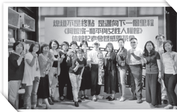
▲ 阿嬤家休館記者會嘉賓合影

期盼在阿嬤家休館的期間大家可以持續關心「慰安婦」以及女性人權的議題，婦援會全體同仁也會盡力在新館的裝修、營運規劃上努力，也請各位親朋好友多多關注阿嬤家的重新開幕以及《蘆葦花開》的繪本發表，希望讓大家再次看見勇敢發聲的阿嬤的力量。