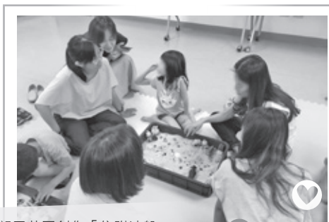
親子共同創作「依附沙盤」

在團體中領導者安排了「依附沙盤」、「製作甜點」等親子共玩活動，透過活動觀察、評估親子間的互動方式，於團體後期領導者亦依著觀察回饋協助家長看見與理解成員們的發展需求、鼓勵家長們以成員們所需求的方式與其互動，並在團體中持續透過親子共玩時光提供機會讓家長們能嘗試練習、增加正向親子互動經驗。初期觀察家長們狀態相當不同，有家長習於以高指導性方式與成員互動、有家長以放任式讓成員自行遊玩，亦有家長採取溝通對話方式引導成員進行遊戲，經過家長們與團體工作團隊間每次的回饋、討論及協助引導下，在最後一次親子共玩團體中可發現家長們與成員們分享彼此畫作的時光中似乎與彼此更加的靠近，為未來親子親密關係創造了更多的可能性。