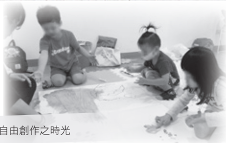
團體成員自由創作之時光

在此團體中透過開放、自由地空間，讓成員們透過各式遊戲或藝術媒材，安心地表達內心情感及想法。團體初期藉由小玩偶作為成員們與家長分離之慰藉，將玩偶帶在身邊讓成員們得到陪伴，而經觀察成員們於剛開始玩樂階段多為各自遊玩，積極想尋求領導者之關注。然經由每次的遊戲過程中可發現在初期總是拒絕與他人玩耍的成員漸漸開始關心、陪伴較年幼的成員，或是當發現年幼的成員間有爭執時