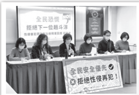
婦女救援基金會、台灣防暴聯盟、現代婦女基金會、勵馨基金會等團體代表及學者，共同出席釋憲回應會

此外，大法官也罕見做出2項「警告性解釋」，要求相關機關三年內應就地點、設置、軟體等設施做有效改善，確保強制治療效果。若無法達到改善，將來若有新的聲請案，不無可能做出違憲的解釋。