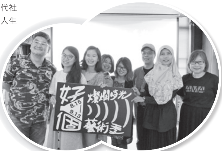
▲ 《好個燦爛時光藝術季》開幕合影

《好個燦爛時光藝術季》試圖呈現了五種觀看路徑，東南亞移動人口自身希望如何被觀看為主軸，當「東南亞」、「移民」、「移工」成為其說故事的背景設定與養分，而不是主題，無需成為母國文化代言人，他們將會如何展現自我，欲打破大家對東南亞移動人口的認知並開啟新的想像。