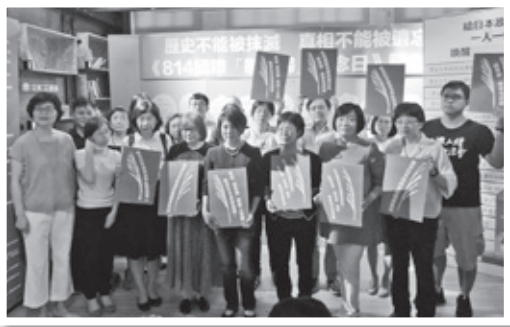
■《814國際「慰安婦」記者會》現場貴賓手舉標語合影

「基金會人員每兩個月都會固定去探望阿嬤們，阿嬤們雖面臨年邁、身體機能退化，但整體來說還算健朗，家屬、孫子女都會多加陪伴，狀況還不錯。」