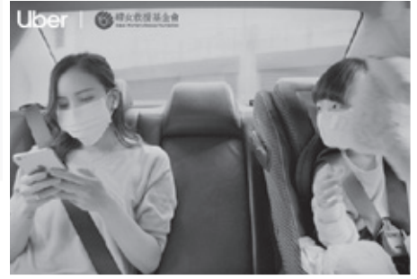
▲ Uber安全同行 x 婦援會

此外，Uber App 在科技上不斷創新，並與注重安全意識的多元化計程車隊合作，加強保障女性乘客從叫車