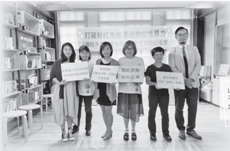
Lulu拒絕數位性暴力《裸照外流不是你的錯》全台首映記者會，出席貴賓合影

許多《數位性暴力》案件都是加害人行「以愛之名，行暴力之實」下發生的，同時，在整個厭女社會氛圍下，實在不易讓被害人發聲，因此，婦援會期盼透過宣導影片的「教育」，讓這些被害人願意勇敢站出來求助，婦援會也與這些被害人站在一起，陪伴、保護、並在復原的路上支持他們。」