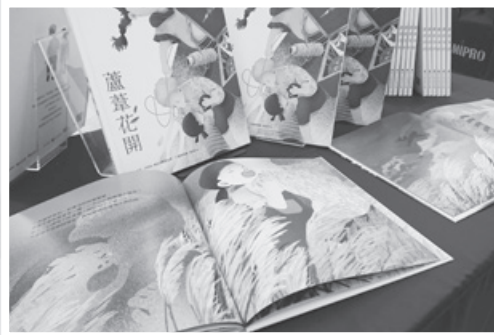
▲《蘆葦花開》繪本採用溫暖細膩的繪圖風格