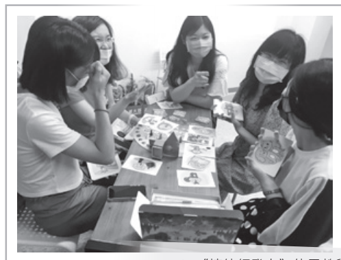
▲ 《情緒抒發卡》使用教學

婦援會舉辦「家庭暴力下兒少情緒管理教育訓練課程」，希望除了專業人員外，在團體、校園、家庭中，人們對於目睹兒少都能有更多瞭解與關懷，也期盼大眾尊重孩子的自主權，並接納孩子心中真實的感受。孩子情緒的背後往往有你我不了解的原因或故事，我們更應該以關懷代替批判，透過不同的思維和做法幫助孩子找到不同的可能跟多元性！