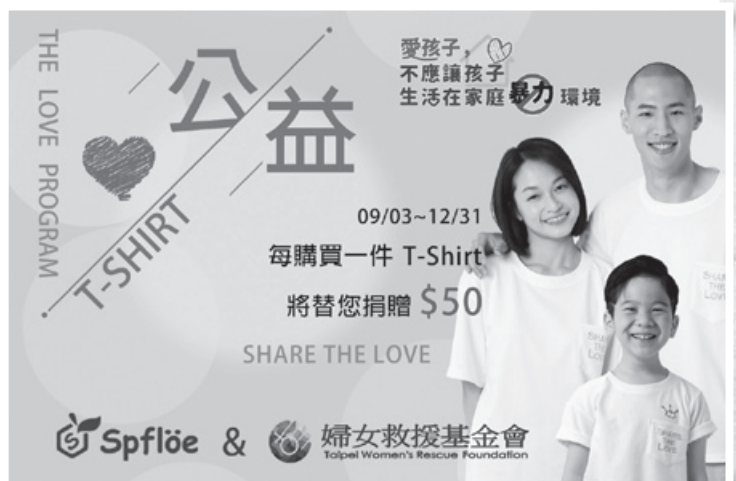
▲ Spfløe 購物平台公益T恤捐款活動

後疫情時代，大家除了持續自主管理做好消毒與戴口罩之防疫工作外，用衣著增加一層保護力，已成為時尚新趨勢。而以舒適、環保、保護力、無毒生活為核心品牌的Spfløe（思活），除了不斷創新衣著產品，也不忘熱心公益，加入守護婦女兒少的行列，與婦援會號召大家9月3日至12月31日一起消費做公益。消費者只要到Spfløe購物平台（ https://www.spfløe.com/ ）購買公益T恤，每成交一件，Spfløe就會幫消費者捐出50元，支持婦援會「目睹兒少」相關服務。穿好衣、做好事，邀請大家以實際行動來守護我們身邊所愛的人，並再度拉進人與人的距離。