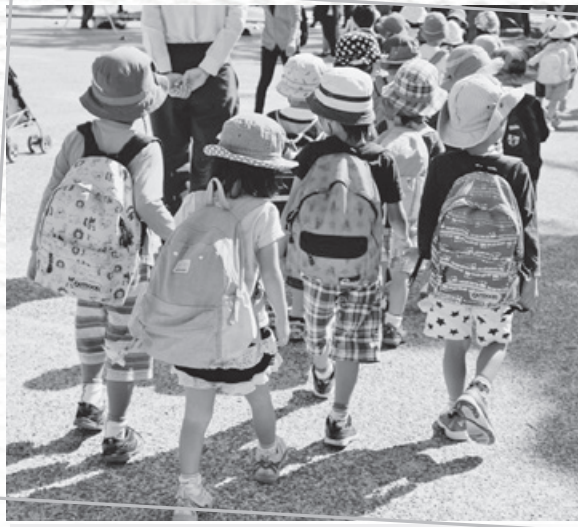
▲ 校園輔導應尊重兒童的意願

然而，從衛生福利部保護司統計資訊網站公布家庭暴力統計中，仍無目睹家暴兒童的數字，雖然通報表中有目睹家暴兒童人數填寫欄位，至今仍無對外公告統計