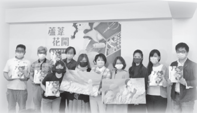
▲《蘆葦花開》新書發表會現場貴賓手拿繪本合影