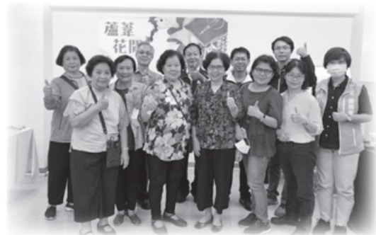
■大同區里長合影，繪本推廣至社區

新書發表會後，婦援會也邀請大同區里長到阿嬤家的新館參觀，到場的里長除了跟婦援會分享關於社區內發生的家庭或暴力事件，同時也肯定婦援會的努力跟議題推廣，會後里長們都獲贈《蘆葦花開》的繪本，將置於里辦公室或里民活動中心等，也期盼教育以及性別意識的風氣在社區紮根，每個人共同努力，打造和諧的社會環境。