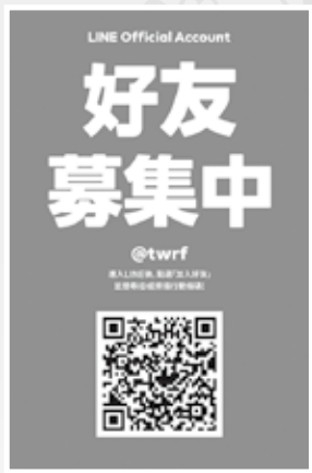
婦援會 Line: @twrf