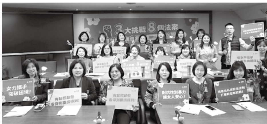
■ 女性立委以及民間團體代表持手牌合影

第一個挑戰「防治性別暴力」，長期由勵馨基金會、婦女救援基金會、台灣展翅協會等民團倡議修法。臺灣需要更完善的法律，對抗「未經同意散布性私密影像」、「deepfake」等新型態犯罪，也需要修法來處理現有的問題，包括目前無法可管的非同居親密關係暴力、員工面對老闆職場性騷擾，尋求救濟時仍有「球員兼裁判」的缺漏，性騷被害人身心承受極大壓力，卻仍沒有法定社工服務等困境。台灣同志諮詢熱線協會則指出，性少數族群可能遭遇更多不同形式的性別暴力，並強調性別平等教育的重要性。