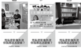
婦援會 IG: womens_rescue_foundation