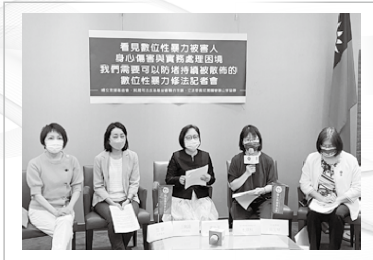
◀ 婦援會邀請學者與立法委員一同召開記者會

近年來隨著科技發展與社群平台越趨多樣化，新型態的性犯罪與性暴力事件也越來越多，婦女救援基金會於2015年至2021年服務了655件數位性暴力求助案件，其中90%是女性，而現行的法律對於相關事件的處理仍未臻完善。