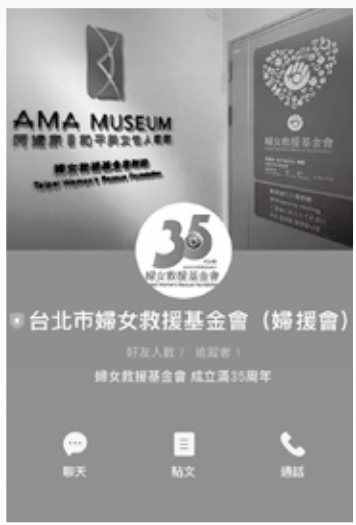
婦援會 Line 好友募集