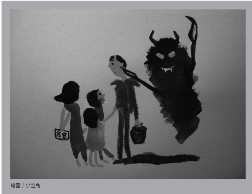
繪圖 / 小芭鳥

印象中丈夫在婚暴案件中總是加害人，男人較易動手打老婆罵孩子；但是其實爸爸也可能是家暴受害者。根據內政部統計婚姻暴力通報案件，受害者男女的比例已從 91 年的 1:18，到 98 年的 1:9，顯示因家暴問題而求助的男性總人數明顯增加。