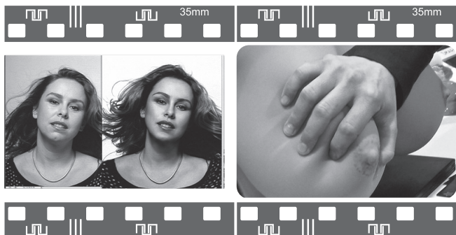
影片之一：整型行不行