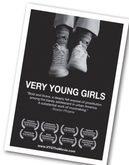
影片之三：少女們啊，妳要去那裡？