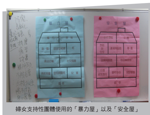
婦女支持性團體使用的「暴力屋」以及「安全屋」

另外，團體成員在團體中分享到來參加這個團體之後的轉變，有人覺得自己變得比以前更勇敢了。過去在暴力的家庭環境中處處遭