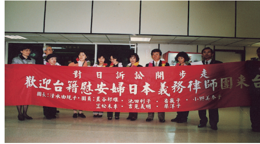
一九九九年「要求日本政府損害賠償訴訟」案開跑

跨海提出正式訴訟（1999 年），以及高等法院三審敗訴（2005 年），這中間所歷經的時間並不能用數小時、數天或數月的單位來計量，因此用時間軸的概念呈現對日訴訟的重要歷程，並真實呈現當時資料、召開記者會的影音片段等，除了讓社會大眾從較嚴肅的法學角度來瞭解該經過並計畫在 2011 年 2 月 25 日舉辦當年義務律師座談會，提供參加者更進一步了解司法訴訟細節的機會。在當事人日漸凋零的同時，藉此表達此議題並不會結束，而是希望把傷痛轉化成歷史教訓的決心。