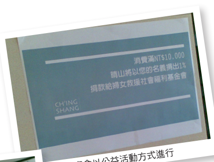
特賣會以公益活動方式進行