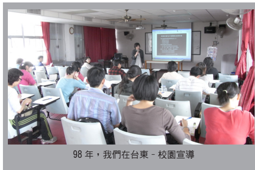
98 年，我們在台東 - 校園宣導

本會規劃了一系列初、進階研習課程及 5 場校園宣導觀摩暨團體督導，並邀請桃園縣所有的校長、輔導老師和導師前來參與，在 8 月的初階研習中，本會的團隊講師協助老師們