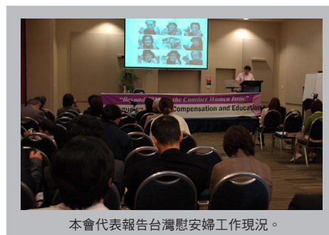
本會代表報告台灣慰安婦工作現況。