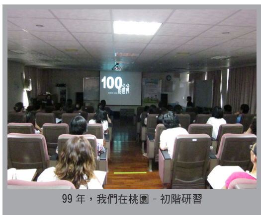
99 年，我們在桃園 - 初階研習