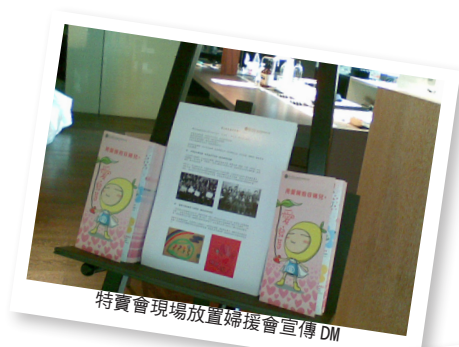
特賣會現場放置婦援會宣傳 DM