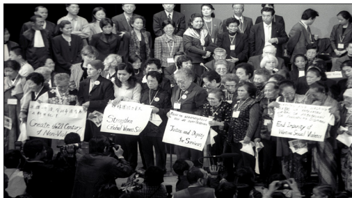
二 000 年東京大審結束後，各國受害者向觀眾致意

近幾年來國際婦女運動成績不俗，但仍有無數女性成為性暴力下的犧牲者，目前台灣僅剩 14 名的慰安婦倖存者，求償官司的敗訴，對垂垂老矣、病痛纏身的倖存阿嬤而言，如同再次否定當年遭遇的所有傷害，遭受嚴重的二度傷害，因此在三審定讞後 5 年，適逢 2000 年東京大審後 10 年的時間點，回首這一路求償官司的歷程與結果，期許在法院敗訴後，尋求為阿嬤們伸張正義的其他道路。