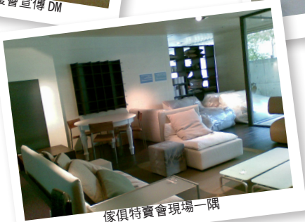
傢俱特賣會現場一隅