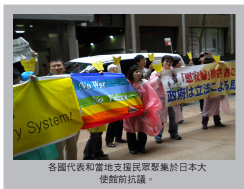
各國代表和當地支援民眾聚集於日本大使館前抗議。