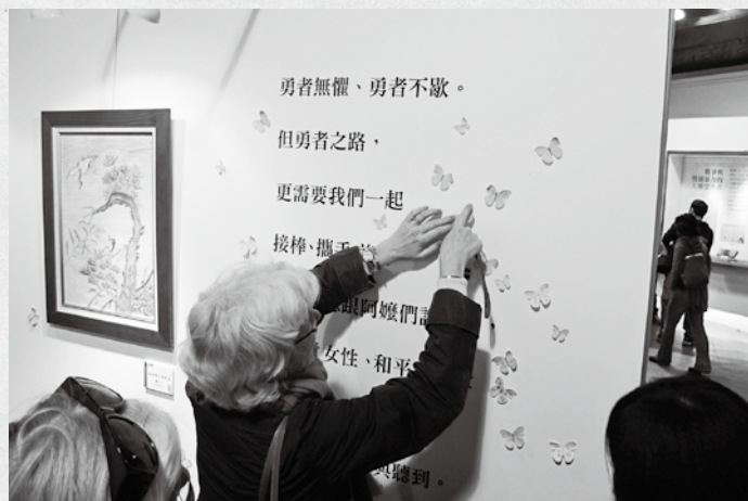
外國來賓將象徵慰安婦阿嬤的紙蝴蝶貼在牆上，獻上關懷與祝福。

康執行長更親自導覽為觀眾一一介紹「生命勇者」、「戰爭與性別暴力的人權受害者」、「暗自吞淚的傷痕—阿嬤的故事」、「勇者無懼」、「傷痕中勇敢前行」、「我們的母親，我們的阿嬤」、「缺席的參與—阿嬤的房間」、「前臺籍慰安婦人權運動20年大事記」、「堅持的理由—女性、和平與安全」等9大主題。而定時放映的國際影片《旅行之歌》，希望以片中戰火動盪下受害人的心靈傷痕，提醒社會大眾維護全球女性人權。和平是一條漫長的未竟之路，我們絕不能停歇。