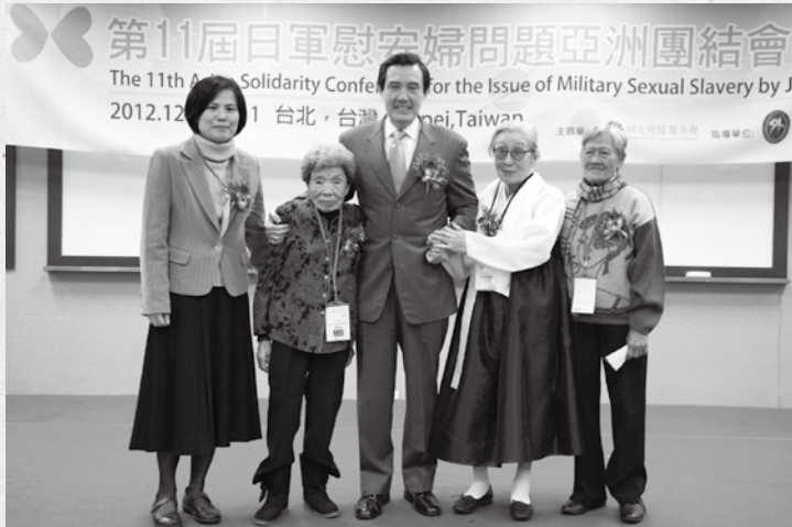
馬英九總統蒞臨現場，表達對阿嬤的支持與關懷與慰安婦議題的重視。