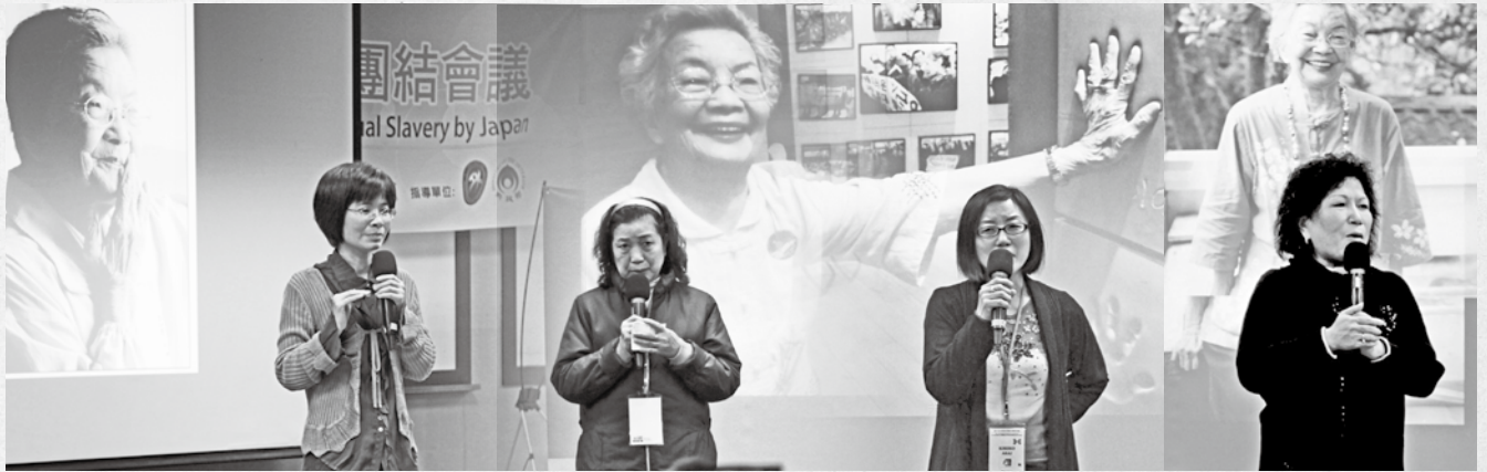
秀妹阿嬤的國際友人，以歌聲表達對阿嬤的思念。