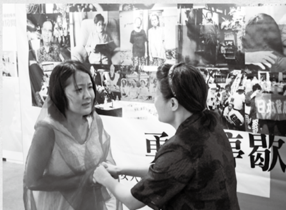
一一擬爾劇場精彩詮釋慰安婦阿嬤的內心衝突。

『我不知道我會被騙，她們告訴我說是去當護士……誰知道，我的未來是變成一個慰安婦！』