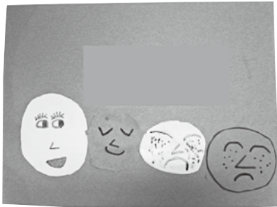
有時候我很生氣，但生氣的背後是難過。

「命運有時候會像一台不斷複製的影印機，複製著上下幾代家人的人生……」成長階段目睹父母親或主要照顧者暴力的孩子，隨著目睹年紀與情況的不同，這些孩子可能會出現不同的身心反應，例如：不安、哭泣、恐懼、自我封閉、注意力不集中，或因自我價值感低落而產生人際關係與社交困難，若未能妥適撫慰孩子因目睹而受創的心靈，部分的孩子在青少年期或成年後，甚至可能會重蹈施暴者的行為、發展以暴制暴的錯誤認知，而進入下一世代的暴力循環。