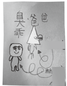
我有時不太喜歡生氣的爸爸。

「家庭」對於人的影響甚鉅，不論在家庭中發生了何種暴力類型，兒童與少年長時間生活在充滿暴力威脅的家庭氣氛之下，對兒童與少年的身心發展都將造成相當大的影響與傷害。因此，我們除了譴責暴力之外，同時希望能夠呼籲社會大眾多關心這些目睹家暴的孩子，讓這些孩子心中埋藏多時的家庭秘密，可以找到信任的對象傾吐；內心的恐懼不安，可以找到傾聽與抒發的出口；對於暴力發生的困惑，可以找到重新澄清與教導的機會；對於無力改變的暴力現象，可以找到支持的力量，知道他和家人都有機會得到幫助；在傷痕累累、孤單無助的情況下，可以在學校找到另一個安全的避風港；覺得被家人拋棄而選擇自暴自棄時，可以發現自己還有夢想的權利。