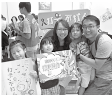
每個人都能成為反暴力行動的一份子。