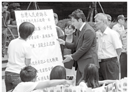
◀ 行動劇表演結束後，日本交流協會雖派出高層聆聽訴求，並接受抗議書和民眾連署的明信片，卻不願對慰安婦問題做任何回應。