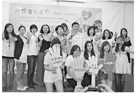
婦援會邀請各界加入「安全手掌」行列，給予目睹暴力兒少更多支持力量。

9月中下旬新竹發生了一起逆倫悲劇，一位長期目睹母親遭受父親家暴的大學生，酒後連刺父親十多刀致死。這樣的不幸事件提醒了我們，有許多外表沒有傷痕的孩子，正無助的夾在大人的戰爭當中，對父母親複雜糾葛的矛盾情緒，找不到適當的情緒出口，加上缺乏求助管道，造成了他們心理上難以癒合的傷痛，而發生了這麼讓人遺憾的案件。