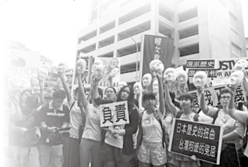
▲ 一大早許多民眾穿著白色上衣主動參加抗議活動。

今年的抗議也比往年有更多的憤怒，除了日本政府至今仍不願承認二戰期間曾強徵慰安婦的暴行之外，更不斷縱容大阪市長橋下徹等極右派政客，發表扭曲史實、貶損慰安婦及全體女性尊嚴的荒謬言論。同時在由台大的學生自發性組成的「阿嬤的紙飛機」團隊號召下，有許多大學生前來聲援，加入抗議行列。