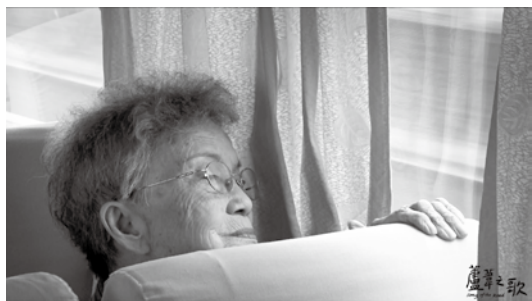
秀妹阿嬤是最年長又富童心的阿嬤，最愛麥當勞的麥脆雞和蘋果派。

1998年由婦女救援基金會出資拍攝的紀錄片【阿嬤的秘密】，是台灣第一部揭露前台籍慰安婦歷史傷痕的紀錄片，過去十幾年來，婦援會陪伴著這群阿嬤們遠赴日本打官司，爭取公道與正義，同時辦理為阿嬤們治療心靈創傷的身心照顧工作坊。然而，隨著時間一天天過去，遲遲等不到日本政府一句正式道歉的阿嬤們，卻一個個懷抱著遺憾離開人世，當年的58位台籍慰安婦倖存者當中，如今，僅僅剩下5位依舊存活。