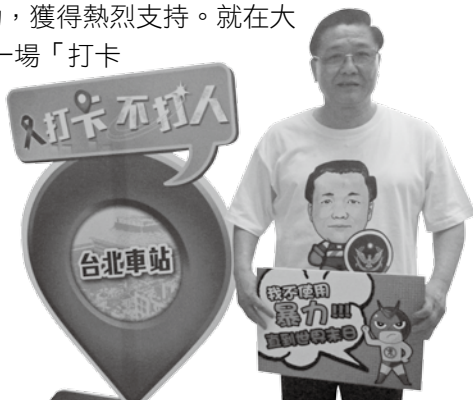
台北市政府警察局黃昇勇局長到場支持活動。