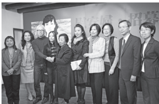
展覽開幕茶會當天出席貴賓合影留念。

展覽相關資訊請上官網專頁 http://www.twrf.org.tw/exhibit2013