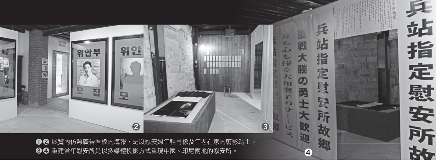
①② 展覽內仿照廣告看板的海報，是以慰安婦年輕肖像及年老在家的剪影為主。 ③④ 重建當年慰安所是以多媒體投影方式重現中國、印尼兩地的慰安所。