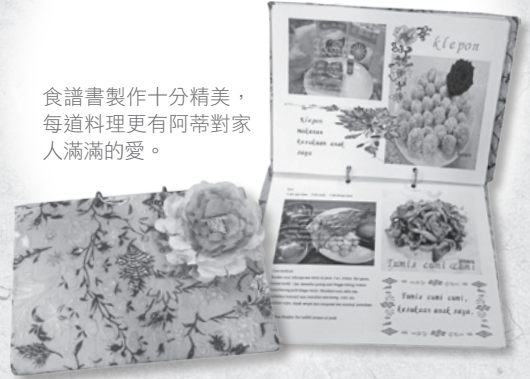
食譜書製作十分精美，每道料理更有阿蒂對家人滿滿的愛。