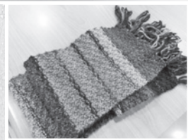
這是成員所編織的圍巾成果。

享時，也能專心編織毛線，享受一段安靜與舒適、安全的時光。像這樣在生活中增加可控制感與決定權，對婦女而言，是相當重要的事。