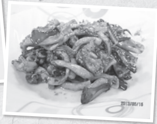
Cumi Cabe Kering_糖醋花枝則是阿蒂兒子的最愛。