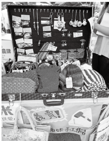
家園姊妹的手作品義賣受到民眾熱烈迴響。