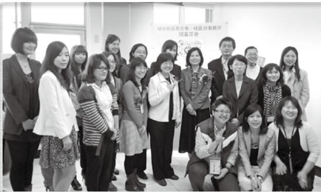
為擴大服務婚暴婦女與目睹暴力兒少，2011年桃園事務所成立。