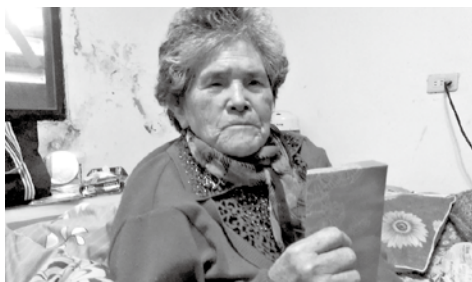
芳美阿嬤特別感謝善心人士的紅包捐贈。