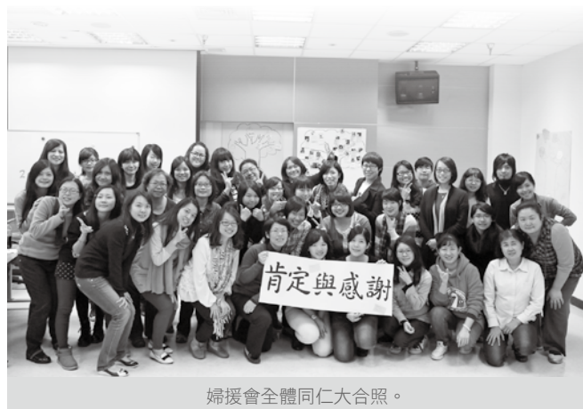
婦援會全體同仁大合照。

被害人，也可以讓未來社會減少被害人的發生；又或者是可以改變社會價值，讓每個人在更平權、更平等的環境中發展自己。董事廖英智說，婦援會是大家可以彼此尊重、一起工作的團體，也是一個把人的價值在組織裡當作是最高基本價值的團體。