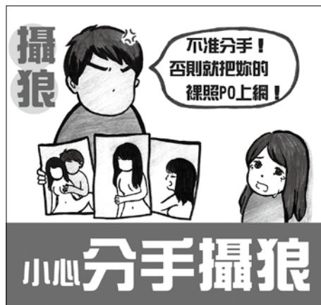
以「公開親密影像」做為恐嚇要脅手段，已是我們迫需正視的新型態親密關係暴力問題。 (汪欣樺繪製)

然而，觀察現行法院對於此類加害人的犯罪行為，大多都只判處六個月以下有期徒刑，並可直接易科罰金。如此輕判結果，亦突顯司法機關於性別意識敏感度之不足，未能真切體認此種犯行對被害人身心及名譽侵害的嚴重性。