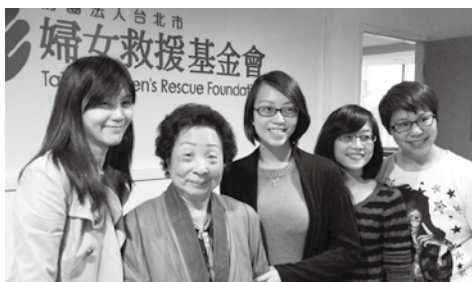
蓮花阿嬤日前親赴本會與同仁話家常。

慰安婦議題自1990年代發酵至今已20餘年，隨著時間的流逝、阿嬤漸漸的消逝，我們最擔心的是慰安婦議題被社會所忽視與遺忘，也間接達成日本政府以時間拖延的手段。