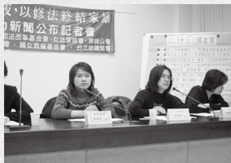
藉由倡議工作，持續為受暴婦女發聲。

無論受暴婦女選擇留下或離開，最重要的是需清楚知道自己擁有身體的自主權，任何人都無權去侵害另外一個人，更不允許使用暴力，社工將會與婦女討論安全計畫，告知受暴時應如何求助及避免再受更嚴重的暴