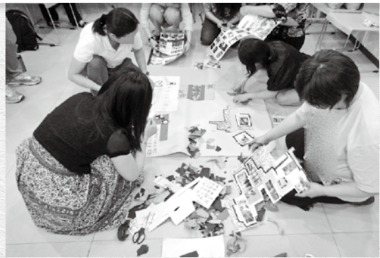
定期辦理婦女支持團體，提供受暴婦女一份安全、陪伴與支持的力量。