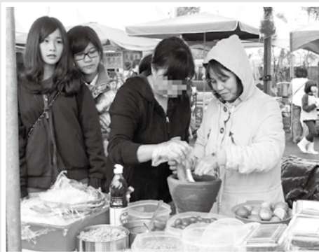
阿珍現場製作泰式涼拌木瓜絲，大受好評。