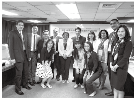
中東代表團參訪移民署，謝立功前署長與該團成員合影留念。

為能使來訪團員深入了解臺灣投入防制工作的努力，本會陪同參訪團前往拜會內政部入出國及移民署、勞動部等政府單位，並前往移民署北區、東區庇護所及收容所進行實地參訪，瞭解臺灣政府近年來如何規劃執行防制工作及成果分享。此外，本會安排臺灣防制人口販運工作中專精實務面的學者、法官、檢察官、律師與NGO夥伴們與參訪團進行分享與討論，使來訪成員們充分瞭解臺灣NGO組織在推動人口販運防制工作上所扮演的角色，如何積極互相串聯，與政府保持合作，並透過司法體系的扶助、庇護家園的安置等管道，提供人口販運被害人最佳保護與協助。由於約旦與臺灣都在2009年通過人口販運防制法，因此雙方針對專法施行現況與困境能進行更多深入討論與交流，透過中東各地代表的分享，也讓臺灣的夥伴對於國際人口販運議題的共同性，以及區域間人力資源遷徙流動的現況有更多啟發與思考。