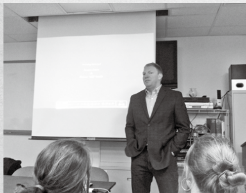
▲ 越來越多的男性投入婦女人權運動中，婦女團體也強調男性參與的重要性。

自從1999年瑞典政府認定性產業有違女性人權，並開始罰嫖不罰娼之後，瑞典的性販運案件減少了兩成，瑞典警察在監聽皮條客電話時，甚至聽到皮條客說「不要去瑞典」，因為在瑞典經營性產業成本太高。瑞