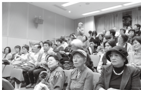
首映會觀眾以中高齡者居多，但發言非常踴躍。