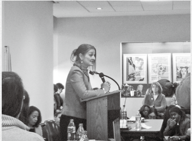
美國性剝削倖存者站出來呼籲大家正視人口販運問題。

割禮等傳統習俗讓莫三比克的女權低落，當地的公民社會團體已開始覺醒，在當地發起停止割禮的社會運動，並邀請男性一起參與，一起改變所有不合理的傳統刻板印象，例如莫三比克的男性認為每天都需要有性行為，不然就會生病，或是不夠有男子氣概。這樣的社會運動雖然受到傳統社會的極大反彈，但是也充權了很多男性與女性，一位在公民社會團體工作的男性說：「我投入女權運動，因為不希望在我生命中的每個女人—我媽媽、姊姊、妹妹、女朋友、太太、女兒—都要和所有莫三比克的女性一樣，遭受不人道的割禮，或是嫁給大她們好幾歲的男人，並且每天活在可能被強暴的陰影中。」