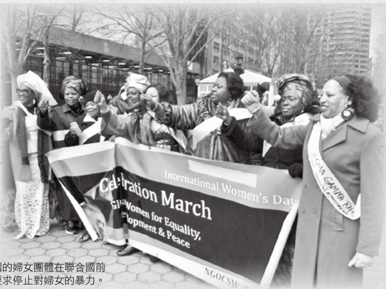
► 來自各國的婦女團體在聯合國前遊行，要求停止對婦女的暴力。