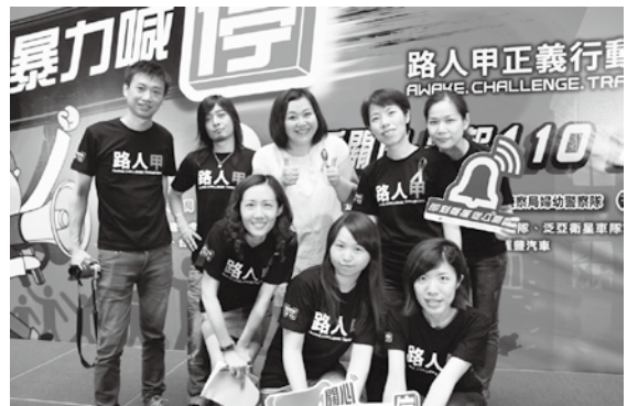
婦援會工作人員穿上「路人甲」T-shirt，一同參與記者會活動。