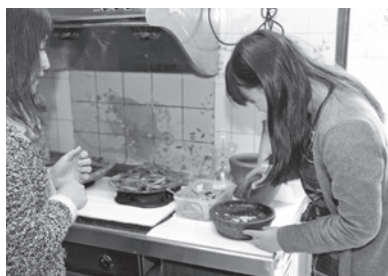
花蓮庇護中心熄燈號「闖關活動」，在廚房體驗研磨醬料樂趣

感情的家園，她期盼每一位離開庇護中心的姊妹，人生道路上再次遇到挫折時，或許因為想起在庇護家園裡，曾經有人陪伴她們走過一段辛苦的歷程，因而能夠重新獲得勇氣與希望。