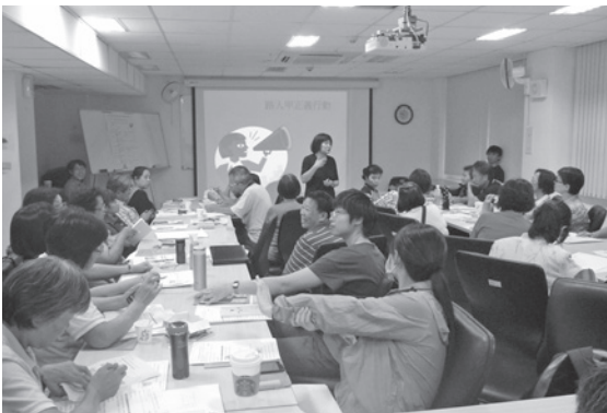
「路人甲正義行動」工作坊上課情形。

婦援會總共印製了2千多本「家庭暴力防治 社區培力手冊」，分別送往台北市各里長辦公室。藉由培養里長和守望相助隊志工成為「路人甲正義行動」的種子部隊，再配合婦援會編撰的家暴防治手冊做為輔助的工具，期望能夠真正深入基層，將「反暴力」觀念推廣到社會各個角落。