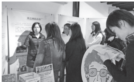
一群日本大學生參觀展覽，聆聽婦援會人員進行解說。

這次的展覽在台北萬華的剝皮寮歷史街區展出期間，吸引不少民眾前來參展，其中最令婦援會同仁們印象深刻的，是十幾位來自日本的大學生，他們在現場聽導覽人員解說到一半時，其中一位日本女學生突然激動落淚，同學們在一旁安慰時，也都跟著紅了眼眶，最後，大家一起對展板上幾位「慰安婦」阿嬤的照片鞠躬致敬，讓婦援會的同仁們相當感動。由於展覽頗獲好評，婦援會特別移師到花蓮的鐵道文化園區繼續展出，這也是婦援會首次在花蓮地區舉辦以「慰安婦」為主題的展覽，沒想到才短短一個星期的時間，就吸引超過400人參觀，受歡迎程度遠超乎預期，婦援會期盼民眾能夠藉由參展，重新反思戰爭對女性人權的剝奪與暴力侵害的問題。