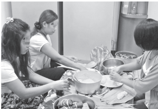
庇護家園裡的姊妹和工作人員一起包柬埔寨粽子。

六年來，家園共有21名具有社工背景的專業工作人員提供姊妹們各項服務，家園工作非一般行政工作所能比擬，除了工作時間需要輪值早晚班外，更需要具有機動性與彈性，所以同仁經常都處於備戰狀態，只要一發生特殊狀況往往需要所有人員取消休假、分工合作共度危機。危機狀態不常見，但只要一發生便大大地考驗團隊凝聚力與合作順暢度。猶記得某次深夜個案遲歸，家園社工生輔全體取消休假，分頭上街找人，大夥都內心忐忑不安，就怕來不及攔阻她們做傻事。好不容易找著人，卻又在街頭吵鬧嚷嚷不肯返家，聽她們哭訴著思鄉、受困的心情，我們感同身受那種身不由己的委屈與無奈。經歷這一夜的奮戰讓團隊深刻地思考經營一個家的本意，危機帶來轉機，我們更明白，一個多元組合的家，必須從自尊自重開始，同理體諒與和解都必須立基在真誠以待