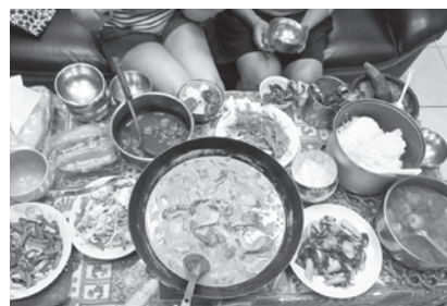
下圖／庇護家園裡大家共享印尼佳餚。