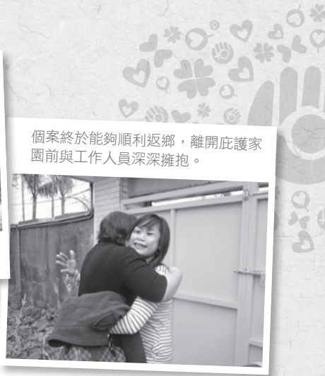
個案終於能夠順利返鄉，離開庇護家園前與工作人員深深擁抱。

我們從司法訴訟的陪伴中，教育姊妹們學習表達與爭取，許多時候因為社工展現出不妥協的態度，讓她們深受影響而願意放手嘗試，掙脫身處弱勢無力反轉的挫折感。我們將自主權交回給姊妹，讓她們從表達、爭取與看見改變中體驗「有講有希望」，真實感受自己所擁有的權力與改變成真，重建自信。我們更從無限創意發想的各類學習中，拓展姊妹們過去受限的生活經驗與視野，為未來開創無限可能。對懷有咖啡館夢想的姊妹，我們自創「朵朵行動咖啡館」，搭配本會活動讓她們現場手沖咖啡給學員品嚐，也提供自製烘焙的蛋黃酥、香草布丁蛋塔、小月餅分享，獲得學員高度讚賞並創造回購率，讓姊妹實現創業夢想的第一步。從姊妹專注於煮咖啡的眼神裡，彷彿也看見她嶄新的希望。家園提供夢想實現的開端，引領姊妹看見自己內在充沛未開發的能量，以及未來的無限可能。