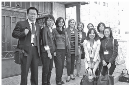
婦援會董事及同仁出訪約旦分享人口販運防制工作經驗。

享台灣在人口販運防制工作上的成功經驗，為整個國際合作案劃下完美的句點。婦援會和Tamkeen中心都相信，本次國際合作計畫雖然告一段落，但未來在打擊人口販運的議題上，雙方必定還有更多合作的空間。