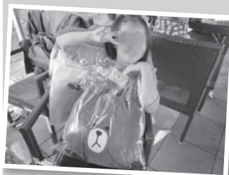
▲ 小朋友收到聖誕禮物好開心。