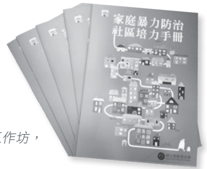
▲ 婦援會印製的「家庭暴力防治 社區培力手冊」。

繼獸醫師公會、台灣大車隊、科技業棋苳公司陸續響應婦援會的「路人甲正義行動」後，為了進一步落實「與社區相結合」的目標，婦援會舉辦兩場工作坊，邀請台北市的里長及守望相助隊志工參加，並且編撰完成一本「家庭暴力防治 社區培力手冊」，期盼讓「正義路人甲」行動真正深入基層。