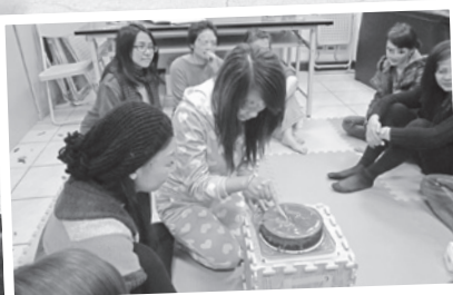
庇護家園獨創的魔法蛋糕儀式，祝福姊妹能早日返鄉。