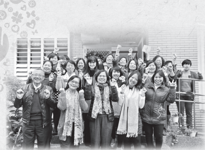
▲ 出席花蓮庇護中心熄燈號活動來賓在家園前合影留念。