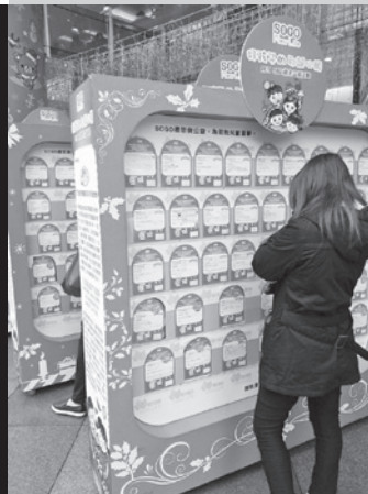
▲ SOGO百貨許願卡認領活動。

婦援會在此誠摯感謝GSK藥廠、SOGO百貨、以及所有參與認領許願卡活動的民眾，因為你們的愛心付出，讓這些受暴婦幼們感受到來自各界的關懷，度過一個充滿溫暖與歡樂的聖誕節。