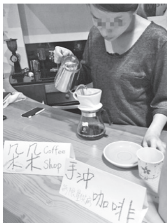
左圖／庇護家園自創「朵朵行動咖啡館」，為個案實現夢想。

六年來，家園從不穩定的草創紮根期，一路摸索嘗試將服務圖像落實，花蓮家園之所以存在，就是希望能給予這群如折翼的鳥兒休養復原的處所，於復原中看見自己，蓄養能量後擺脫牢籠、振翅飛翔，飛往屬於自己的未來，無論飛往哪個方向終有屬於自己的意義，都有我們深深地祝福。雖然家園熄燈謝幕，但婦援會對人口販運被害人的保護工作將持續前行，也希望終有一天我們真能全然地熄燈謝幕，終結人口販運。