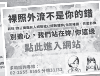
「裸照外流不是你的錯」網站