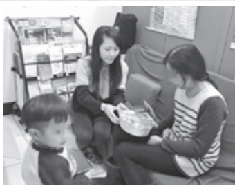
收到善心人士捐贈的現做年菜，受暴婦女感動落淚

謝經理一方面透過臉書號召朋友參與認購年菜，另一方面，婦援會同仁也統計出有這樣需求的個案數量，最後，總共有23份熱騰騰的現做年菜，在農曆過年前順利送到23個婦援會的個案手中，由於其中有幾位受暴婦女是外籍配偶，第一次有機會吃到櫻花蝦油飯、佛跳牆這樣的台灣傳統年菜，忍不住感動落淚，而小朋友更是開心到「哇！」的一聲，看著年菜，眼睛都亮了起來。謝經理承諾，未來希望長期跟婦援會合作，婦援會在此深深感謝所有認購年菜的朋友們，一份年菜，不只暖了受暴婦幼的胃，更溫暖了他們的心。