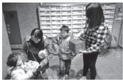
▲看到從沒吃過的豐盛年菜，小朋友好開心