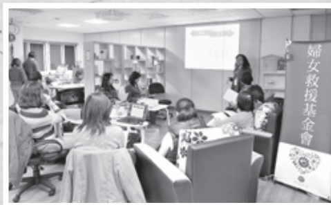
「Power Women Group」婦女培力團體

想法，參與培力團體的成員們都認為這項禁忌極不合理，應該盡早破除改正才是。「Power Women Group」婦女培力團體希望能帶領婦女朋友們透過討論與分享擺脫傳統束縛，去探索並激發出更多能量。