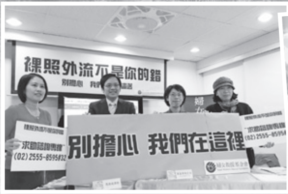
「裸照外流不是你的錯」記者會