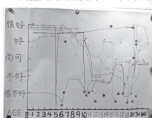
▼ 團體成員所繪製的生命曲線圖