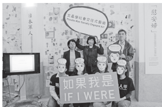
■「如果我是」展覽開幕記者會

「如果我是 If I Were」展覽，展期從12月10號至12月27號為止，我們特別在12月12號星期六安排一場由「知了劇團」以「一人一故事劇場」方式與展場民眾互動的活動，主題為「不能說的秘密」，由於大部分的台灣「慰安婦」阿嬤不敢向人提起曾經受害的過往，因