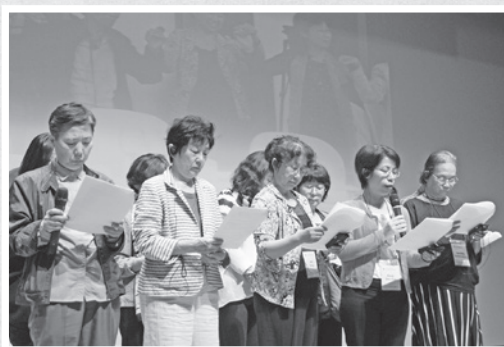
■ 2015年5月，於韓國首爾召開第13屆日軍「慰安婦」問題亞洲團結會議上，各國代表上台宣讀此次會議決議文

在2015年5月21日至5月24日於韓國首爾召開的第13屆日軍「慰安婦」問題亞洲團結會議上，本會和與會的「慰安婦」倖存者及各國「慰安婦」支援團體，有著一致的共識，本會對否認日軍「慰安婦」及侵略戰爭責任的日本政府提出嚴重警告，亦決議要敦促受害國政府為恢復受害者的人權和實現和平履行相應職責。