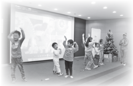
■ 小朋友開心跳起妖怪手錶帶動跳