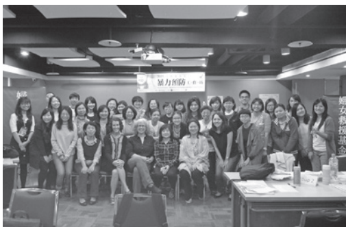
■ 暴力預防工作坊講師與學員合影留念

除了11月11號的大型國際研討會之外，婦援會還針對社工、諮商師等專業人士舉辦為期兩天的工作坊，總共有37人參加。Green Dot 執行長愛德華博士以情境故事及影片，讓學員實際觀察其中的紅點警訊，並思考「如果自己是旁觀者，會採取什麼行動介入？」，同時將學員分成7組，以分組競賽方式鼓勵各組進行腦力激盪，想出各種不同的行動策略並分享宣導的技巧。愛德華博士透過幽默豐富的肢體和語言帶領大家思考，讓所有參與工作坊的學員都覺得獲益良多。婦援會執行長康淑華表示，暴力預防必須從小紮根，從社區紮根，這是非常重要的工作，Green Dot 的成功經驗，可以提供台灣作為很好的參考借鏡，讓我們找到屬於台灣自己本土的力量與一套適合台灣的工作模式，希望未來有更多團體和夥伴一起加入暴力介入與預防的行列。