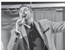
■ Christmas Cabaret 活動，表演者在台上高歌獻唱