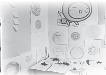
■ 團體成員藝術創作