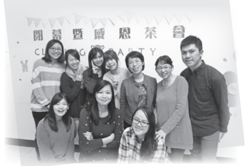
▲閉幕暨感恩茶會上，桃園分事務所同仁合影留念