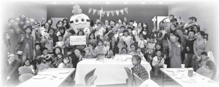
■ 受暴婦幼及婦援會同仁出席聖誕派對