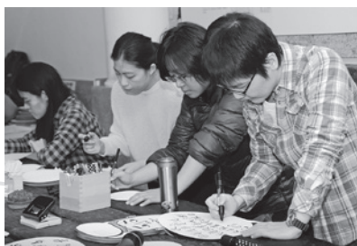
▲參觀展覽民眾現場參與創作