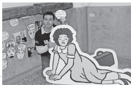
▲民眾寫下心中感想與人形立牌合影