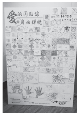
■ 禪繞畫百人集體創作成品

不少民眾在花蓮婦女中心設計的「愛的小卡」上寫了鼓勵創作者的溫馨話語，我們從這200多位民眾當中抽出46位幸運得主，贈送他們包括珍珠項鍊、精油棒等精美小禮品，感謝大家的踴躍參與與支持，也為這次展覽畫下一個美好的句點。