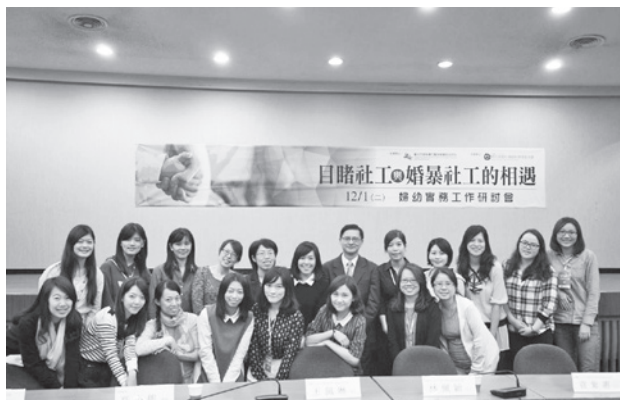
■ 婦援會婦幼部同仁全員出動參與此次研討會

除了婦援會之外，研討會上還有其他同樣從事目睹兒少服務工作的民間團體，分享各自不同的經