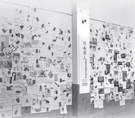
▲「如果我是」展覽展場作品