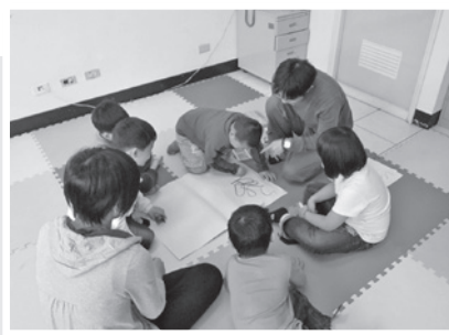
▲為目睹兒少服務個案舉辦兒童團體