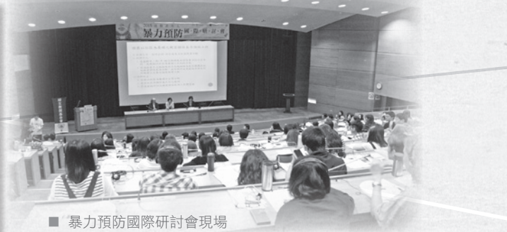
■ 暴力預防國際研討會現場