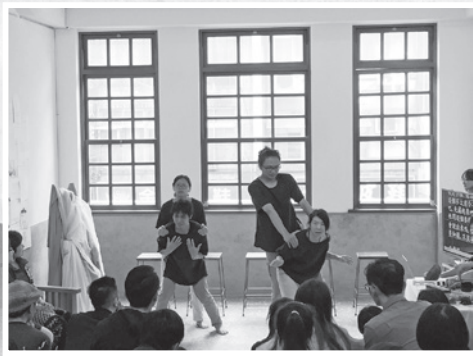
■「知了劇團」即興表演「不能說的秘密」