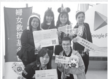
■ 婦援會參與 Google Play 遊樂園活動

兩次的Google Play遊樂園擺攤活動，不少民眾對於婦援會所設計的問答遊戲反應相當好，也表示學習到一些很有用的技巧和概念，婦援會希望經由這樣寓教於樂的方式，讓更多家長、孩子及社會大眾一起加入我們「反性別暴力行動 ACTION！」的行列。