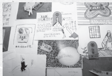
▲「如果我是」展覽展場作品 2

師特別強調「同理心」很重要，透過這樣的互動式設計，讓民眾從「展覽參觀者」的角色，轉變成為「展覽創作者」的一份子，對「慰安婦」議題進行更深入的反思。