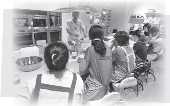
▲為受暴婦女服務個案舉辦烘焙團體

然而，可惜的是，由於桃園地區招募社工不易，婦援會桃園分事務所一直處在人力不足的情況下，同仁們被迫「一個人當兩個人用」，長期下來，工作壓力已經超過大家所能負荷的限度，於是，只好忍痛做出決定，在2015年底正式結束婦援會桃園分事務所的運作。12月8號，桃園的同仁們特別舉辦一場溫馨的閉幕暨感恩茶會，包括桃園市家防中心、勵馨基金會桃園分會、中華民國基督教女青年