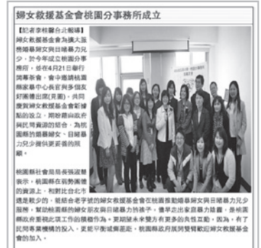
媒體報導桃園事務所成立新聞 (自立晚報)

5年前，憑藉著一股服務的熱忱，婦援會接受當時桃園縣家防中心的邀請，開始接下當地目睹家暴兒少的服務工作，之後並成立「婦援會桃園分事務所」。歷經不斷摸索，慢慢找出適合桃園受暴婦幼的在地化服務方向。然而，因社工人力長期不足，桃園分事務所被迫在2015年底正式熄燈，結束運作。