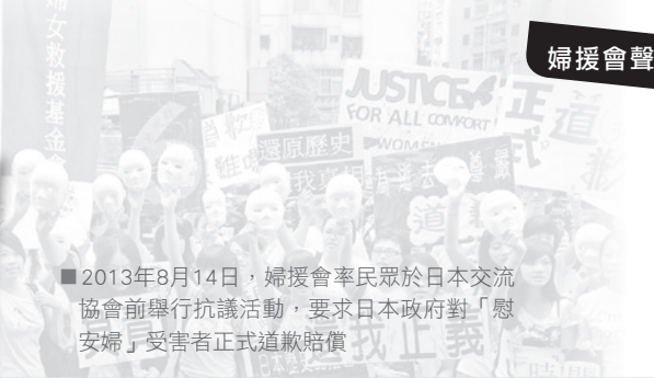
■ 2013年8月14日，婦援會率民眾於日本交流協會前舉行抗議活動，要求日本政府對「慰安婦」受害者正式道歉賠償

本會要求日本政府必須真心誠意的反省及道歉，承擔法律責任，並給付被害人「賠償金」，故雙方政府在協商解決「慰安婦」問題時，務必以恢復前台籍「慰安婦」的名譽與尊嚴列為第一優先，並以聯合國人權委員會在1996年的「慰安婦」調查報告所提出的建議為參考，做到下列幾點：