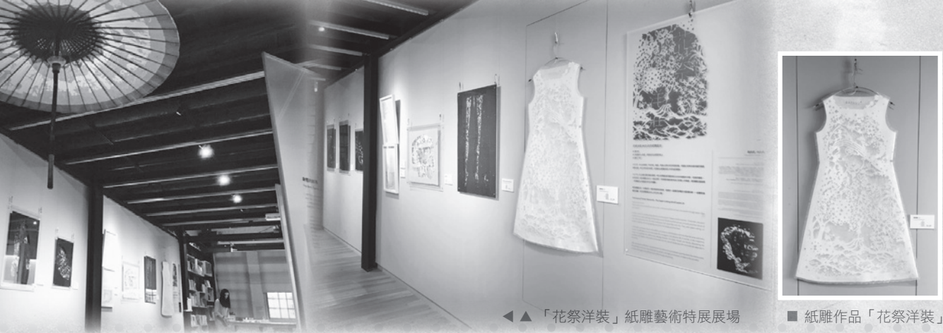
◀ ▲ 「花祭洋裝」紙雕藝術特展展場