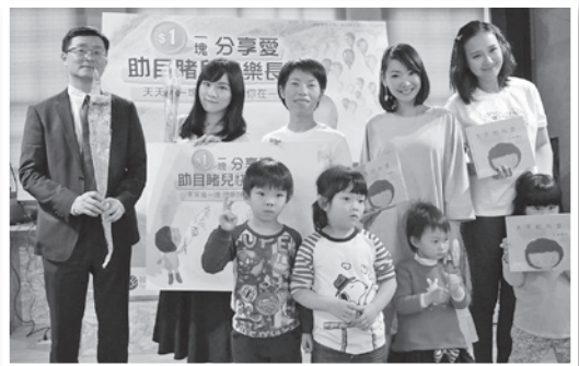
■ 婦援會號召民眾捐款幫助目睹兒

婦援會今年的「一塊分享愛，助目睹兒快樂長大」方案，分成「一次捐」、「定額捐」等多種不同捐款方式，募得的款項將提供受暴婦幼急難救助金、免費法律諮詢、人身安全保護計畫、專業心理輔導諮商等等。另外，也歡迎企業響應我們的《天天的烏雲》兒童繪本公益贈書計畫。婦援會特別感謝伊聖詩和ORBIS贊助此次方案的捐款回饋禮品，以及台灣大車隊和華南銀行協助擺放「一塊分享愛，助目睹兒快樂長大」活動DM。期盼有更多民眾和企業加入我們的行列，用愛的力量，一起在復原路上陪伴目睹兒長大。