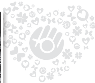
■ 友善路人甲 園遊會宣導