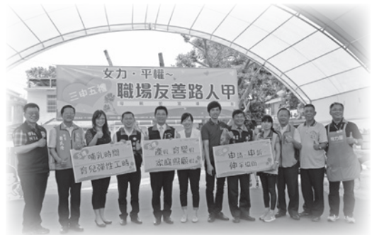
■ 多位貴賓出席支持花蓮婦女中心母親節活動

「三申五禮」的宣傳單張及減壓鞋墊等宣導品，並且現場進行有獎徵答，以深入夜市的方式與民眾互動，對婦女的辛勞表達關懷，同時也達到提醒婦女朋友們注意自身勞動權益及推動職場性平意識的宣導目的。